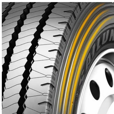
Sidewall protection to resist curb scrubbing.

Tringle de renfort de flanc pour protéger le pneu contre l'abrasion causée par le frottement avec les bords de trottoir